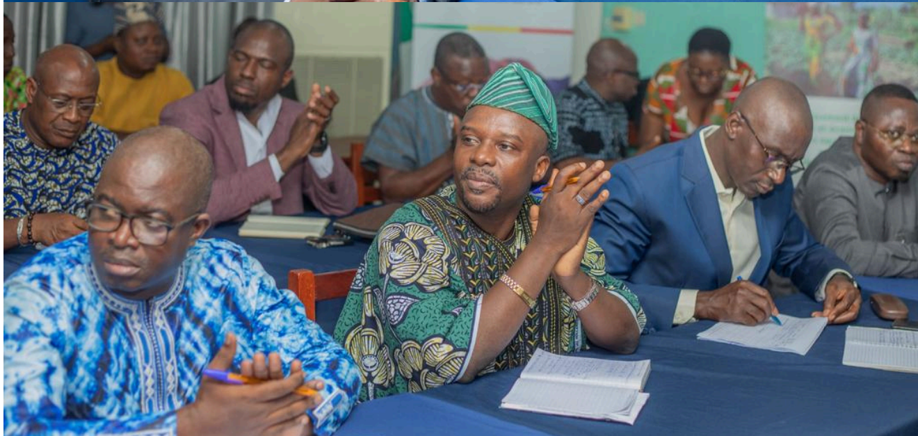
Vue partielle des participants à la rencontre avec le ministre