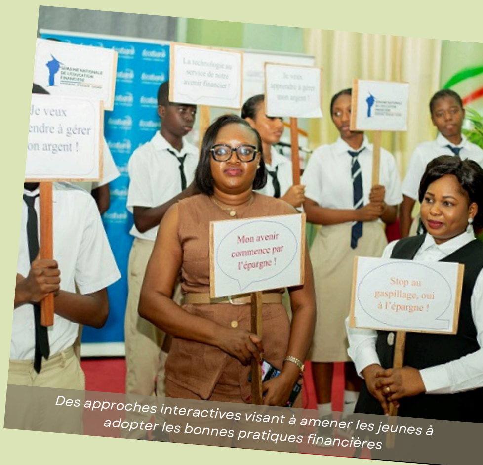
Des approches interactives visant à amener les jeunes à adopter les bonnes pratiques financières

À travers une mobilisation collective et des actions concrètes, cette initiative ouvre la voie à une autonomisation accrue des populations, en particulier des jeunes, dans un environnement financier en constante évolution.