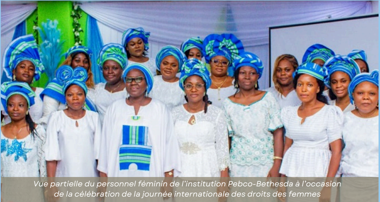
Vue partielle du personnel féminin de l'institution Pebco-Bethesda à l'occasion de la célébration de la journée internationale des droits des femmes

Dans le cadre de la célébration de la Journée internationale des droits des femmes, l'institution de microfinance Pebco-Bethesda a organisé, le vendredi 27 mars 2026, une cérémonie dédiée à la fois à la valorisation de la gent féminine et à la distinction de ses meilleures clientes. À travers cette initiative, l'institution réaffirme son engagement en faveur de l'autonomisation des femmes et du développement inclusif.