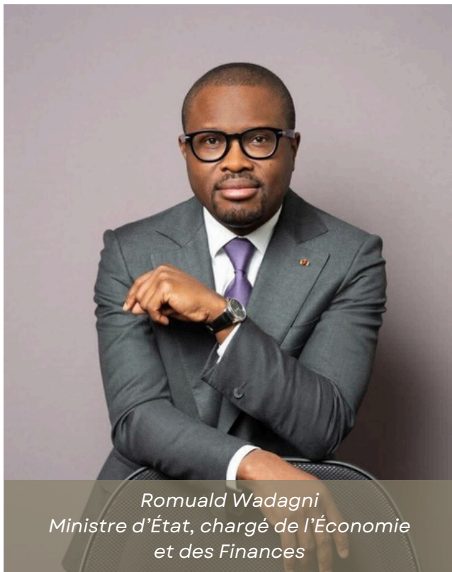
Romuald Wadagni Ministre d'État, chargé de l'Économie et des Finances

Les Imf ont également plaidé pour un renforcement de l'accompagnement technique, en particulier en matière de formation et de renforcement des capacités, afin de mieux contribuer à l'inclusion financière des populations.