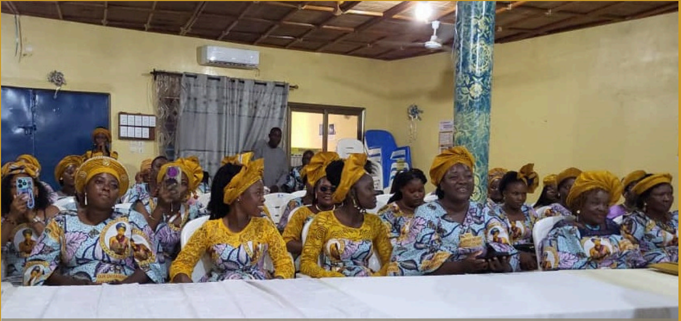
Vue partielle du personnel féminin et des Élués femmes de l'institutions de microfinance Africa Finances à l'occasion de la célébration de la journée internationale des droits des femmes

À l'occasion de la Journée internationale des droits des femmes, Africa Finances a organisé, le 21 mars 2026 à son siège, une cérémonie dédiée à la valorisation de son personnel féminin. Initiée conjointement par la Direction générale et l'Amicale des femmes, cette rencontre s'inscrit dans une dynamique de reconnaissance du rôle déterminant des femmes, tant au sein de l'institution que dans le secteur financier.