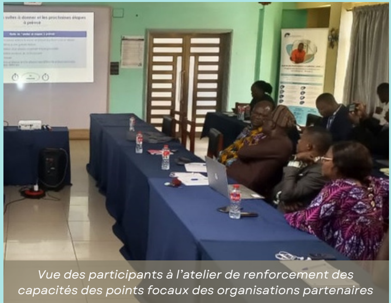
Vue des participants à l'atelier de renforcement des capacités des points focaux des organisations partenaires

L'atelier, organisé sur deux jours, a réuni les points focaux des structures partenaires ayant signé des accords avec EnDev. Parmi celles-ci figurent l'Association professionnelle des systèmes financiers décentralisés dans le domaine de la finance verte, ainsi que des entreprises telles que Qotto, Lagazel, Villageboom et Takaz, actives dans la fourniture de solutions solaires. L'Agence Nationale de Normalisation de Métrologie et de Contrôle Qualité a