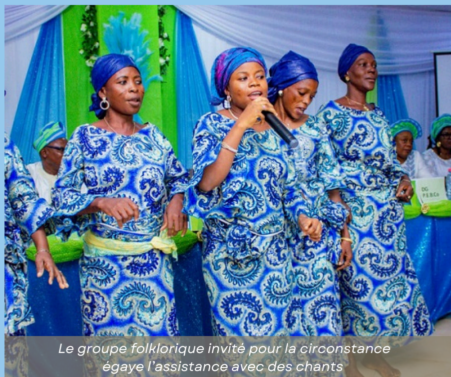
Le groupe folklorique invité pour la circonstance égaye l'assistance avec des chants

d'interventions et d'activités. Les allocutions officielles ont mis en lumière le rôle central des femmes dans le développement économique et social, tout en rappelant l'engagement constant de Pebco-Bethesda à accompagner ses clientes dans leurs initiatives entrepreneuriales. Le moment phare de la cérémonie a été la distinction des meilleures clientes. Dans une ambiance empreinte de fierté et d'émotion, plusieurs d'entre elles ont été honorées pour leur parcours, leur rigueur et leur impact au sein de leurs communautés. À travers ces distinctions, l'institution célèbre une vision claire : celle d'une microfinance au service de l'autonomie financière des populations.