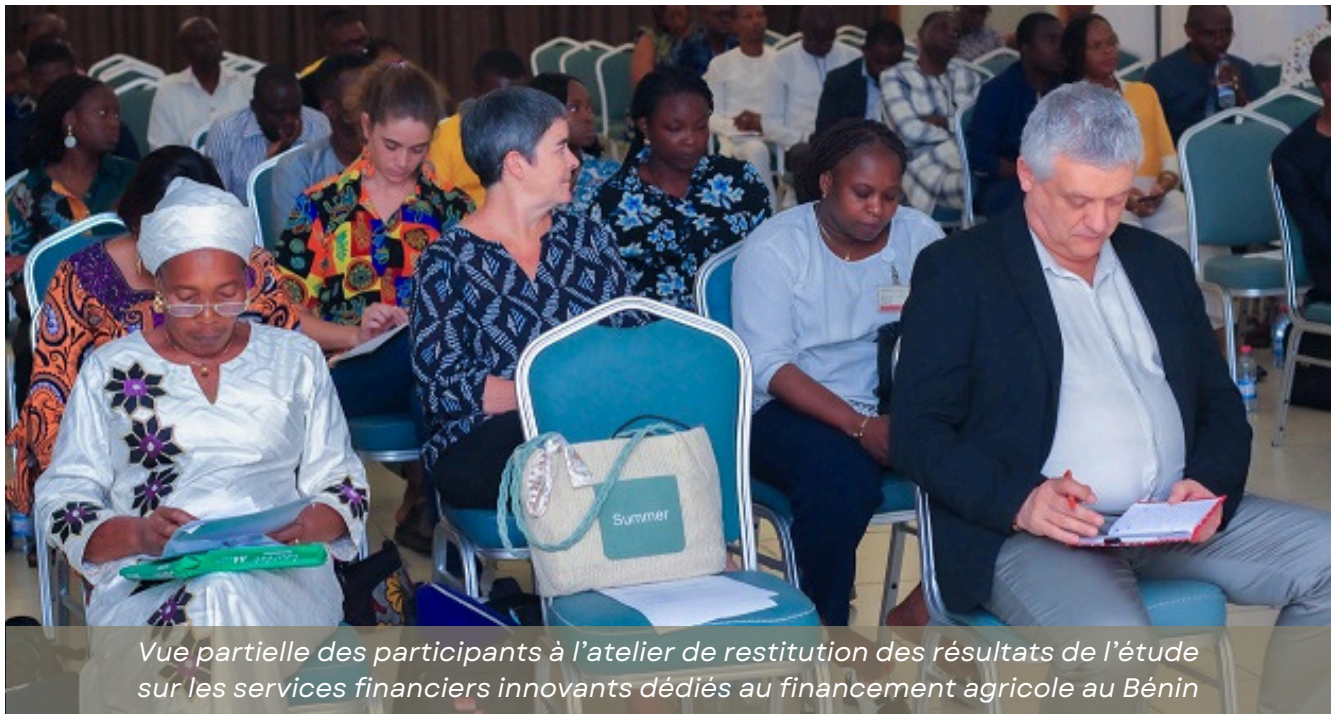
Vue partielle des participants à l'atelier de restitution des résultats de l'étude sur les services financiers innovants dédiés au financement agricole au Bénin

Un atelier de restitution des résultats de l'étude sur les services financiers innovants dédiés au financement agricole au Bénin s'est tenu le mardi 10 mars 2026 à l'Hôtel du Lac à Cotonou. Financée par Swisscontact dans le cadre du projet Béninclusif, cette étude vise à identifier et promouvoir des mécanismes financiers adaptés aux besoins des acteurs du secteur agricole, en particulier les producteurs et les petites entreprises rurales.