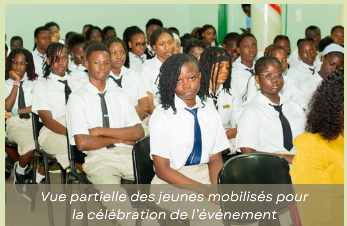
Vue partielle des jeunes mobilisés pour la célébration de l'événement