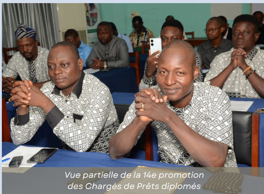
Vue partielle de la 14e promotion des Chargés de Prêts diplômés