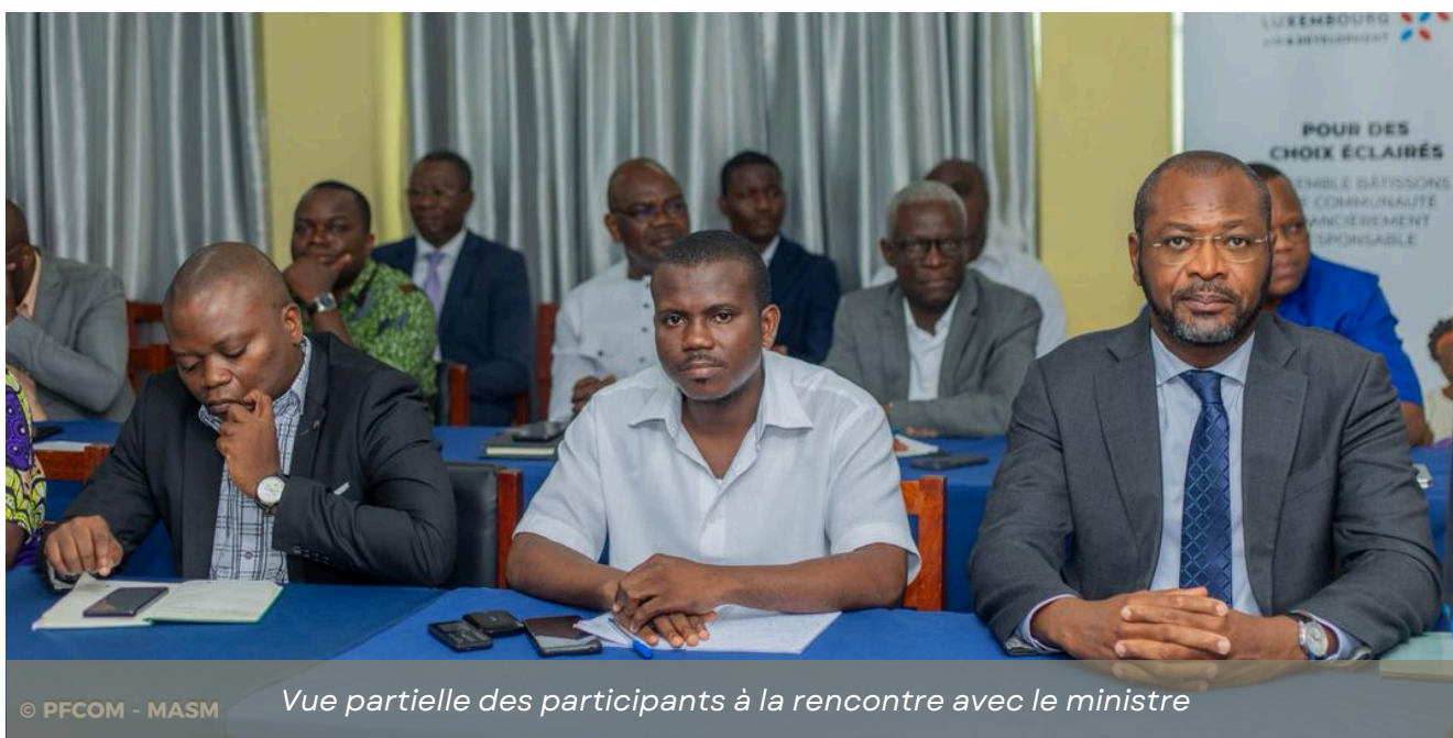
Vue partielle des participants à la rencontre avec le ministre

L'annonce majeure de la rencontre reste la généralisation du programme de microcrédit Alafia III à compter du 1er avril 2026, après une phase pilote jugée concluante. La ministre a précisé que le Conseil des ministres a validé la prise en charge des frais de gestion des trois phases du programme, pour un montant de 984 199 281 francs CFA.