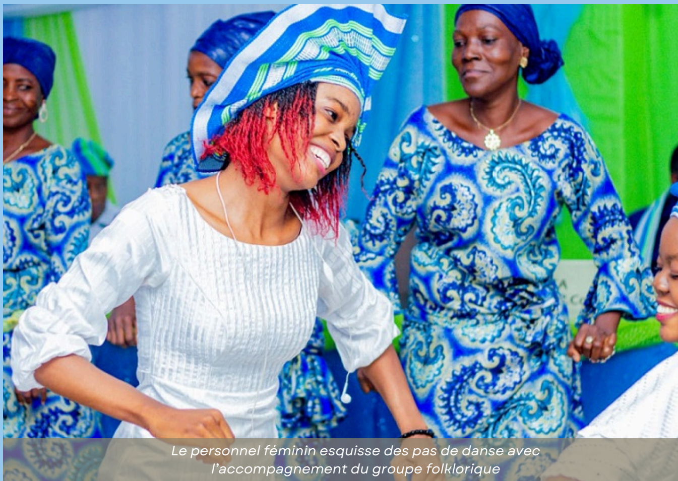
Le personnel féminin esquisse des pas de danse avec l'accompagnement du groupe folklorique

Une conviction s'impose alors comme une évidence: lorsque les femmes progressent, c'est toute la société qui avance.