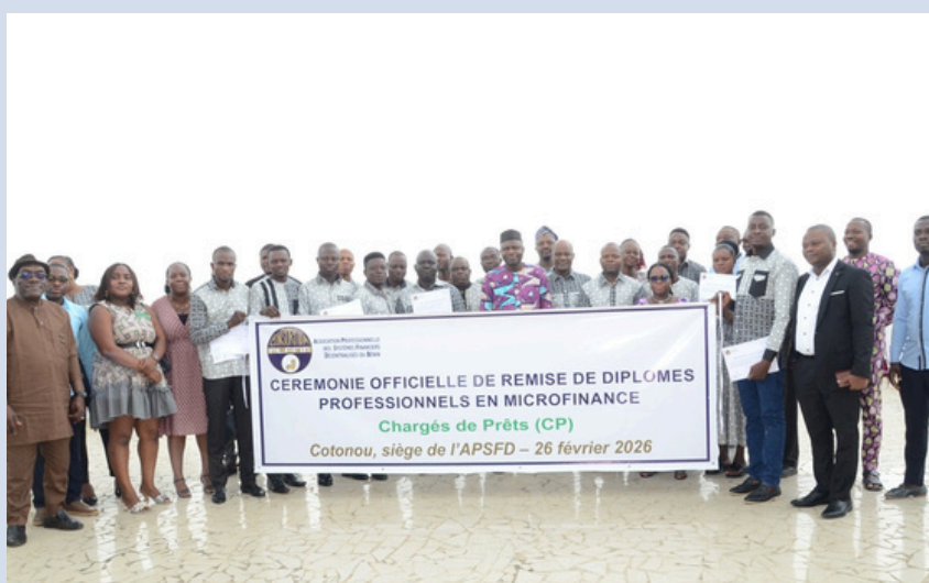
Photo de famille des récipiendaires avec les invités à la cérémonie officielle de remise de diplômes

À travers cette initiative, l'Association professionnelle des systèmes financiers Décentralisés confirme son rôle clé dans le développement des compétences et la structuration du secteur de la microfinance au Bénin.