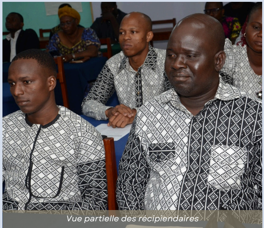
Vue partielle des récipiendaires