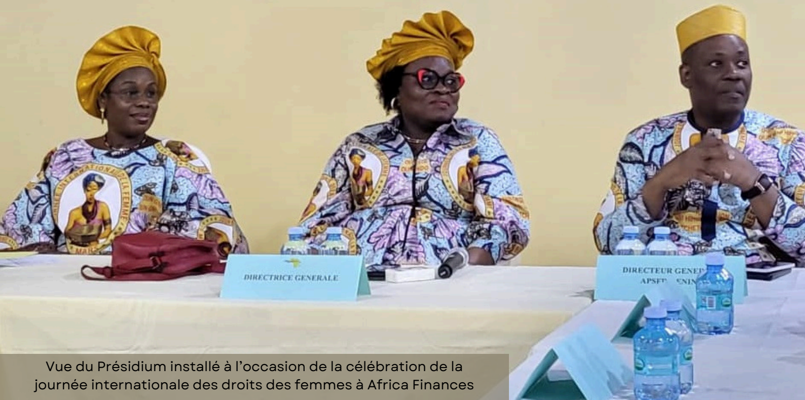
Vue du Présidium installé à l'occasion de la célébration de la journée internationale des droits des femmes à Africa Finances

Dans son intervention, le Directeur de l'Apsfd a salué les efforts d'Africa Finances en matière de promotion d'un environnement de travail inclusif et favorable à l'épanouissement des femmes. Il a par ailleurs souligné la nécessité de poursuivre les actions en faveur de leur autonomisation économique, tout en renforçant les mécanismes de bonne gouvernance et de transparence. La participation des élues femmes a également contribué à enrichir les échanges, en apportant un éclairage institutionnel et sociétal sur les enjeux liés au leadership féminin.