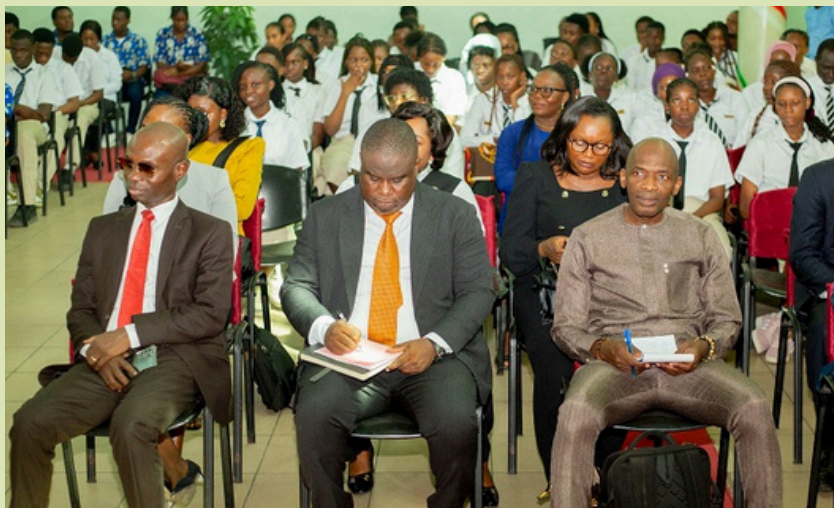
Vue partielle des participants aux activités de SIF Groupe

À cette occasion, SIF Groupe a décerné une distinction honorifique à Ecobank Bénin, en reconnaissance de sa participation continue aux huit éditions de la Semaine mondiale de l'argent.